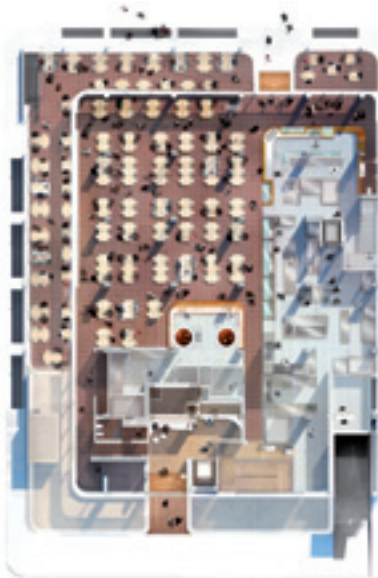
Trampolines Suite Hotel - Ground floor