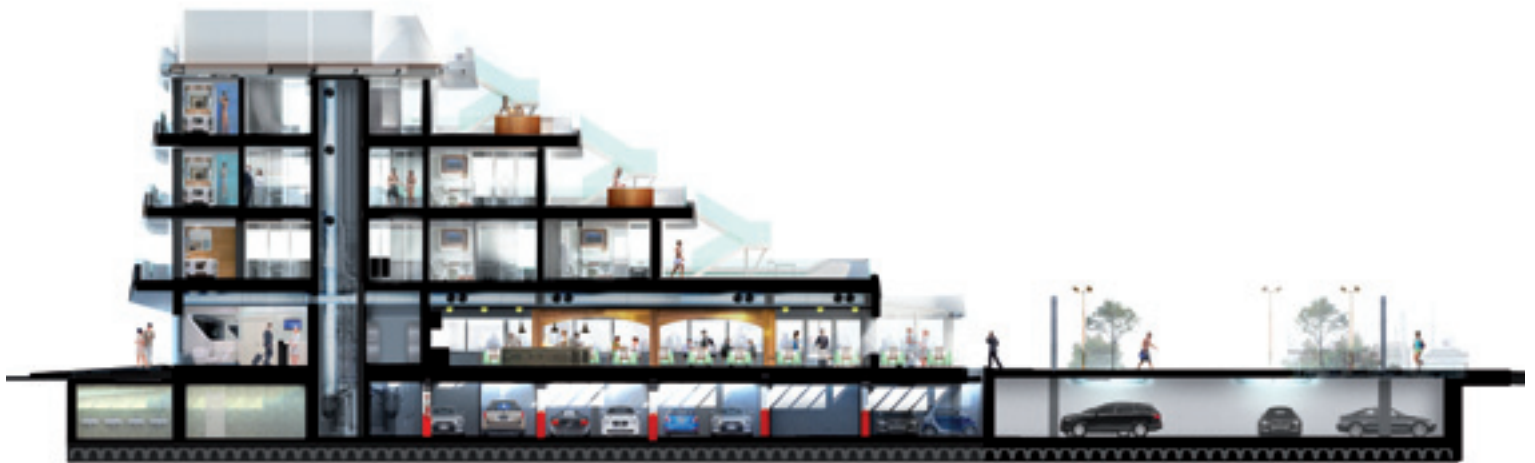
Trampolines Suite Hotel - BB Section