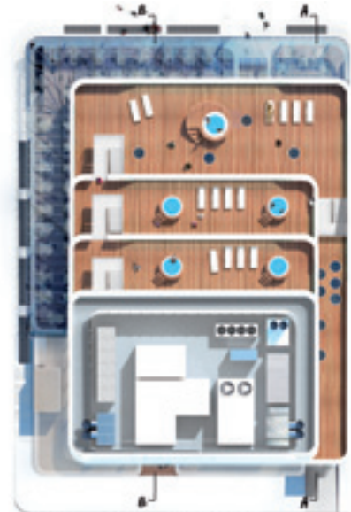
Trampolines Suite Hotel - Rooftop