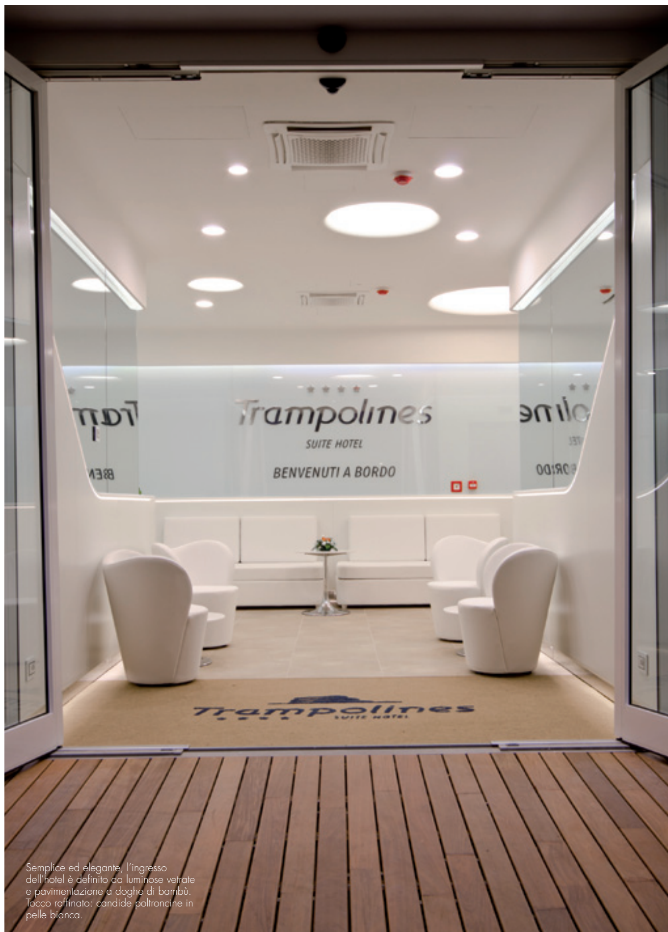
Semplice ed elegante, l'ingresso dell'hotel è definito da luminose vetrate e pavimentazione a doghe di bambù. Tocco raffinato: candide poltroncine in pelle bianca.