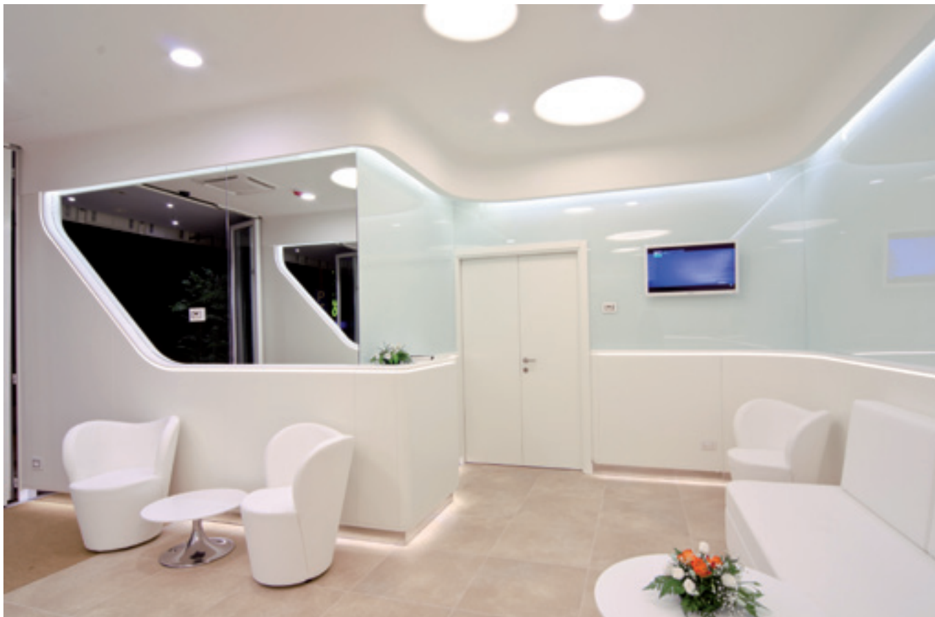
La hall dominata dalbianco assoluto delle superfici laccate e dei ripiani in Corian®, conferisce all'ambiente un'atmosfera di elegante purezza.