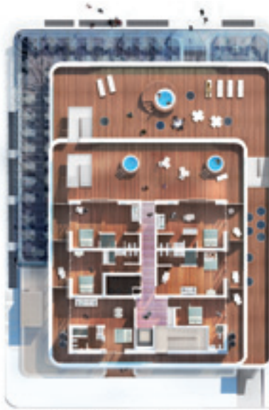
Trampolines Suite Hotel - Second floor